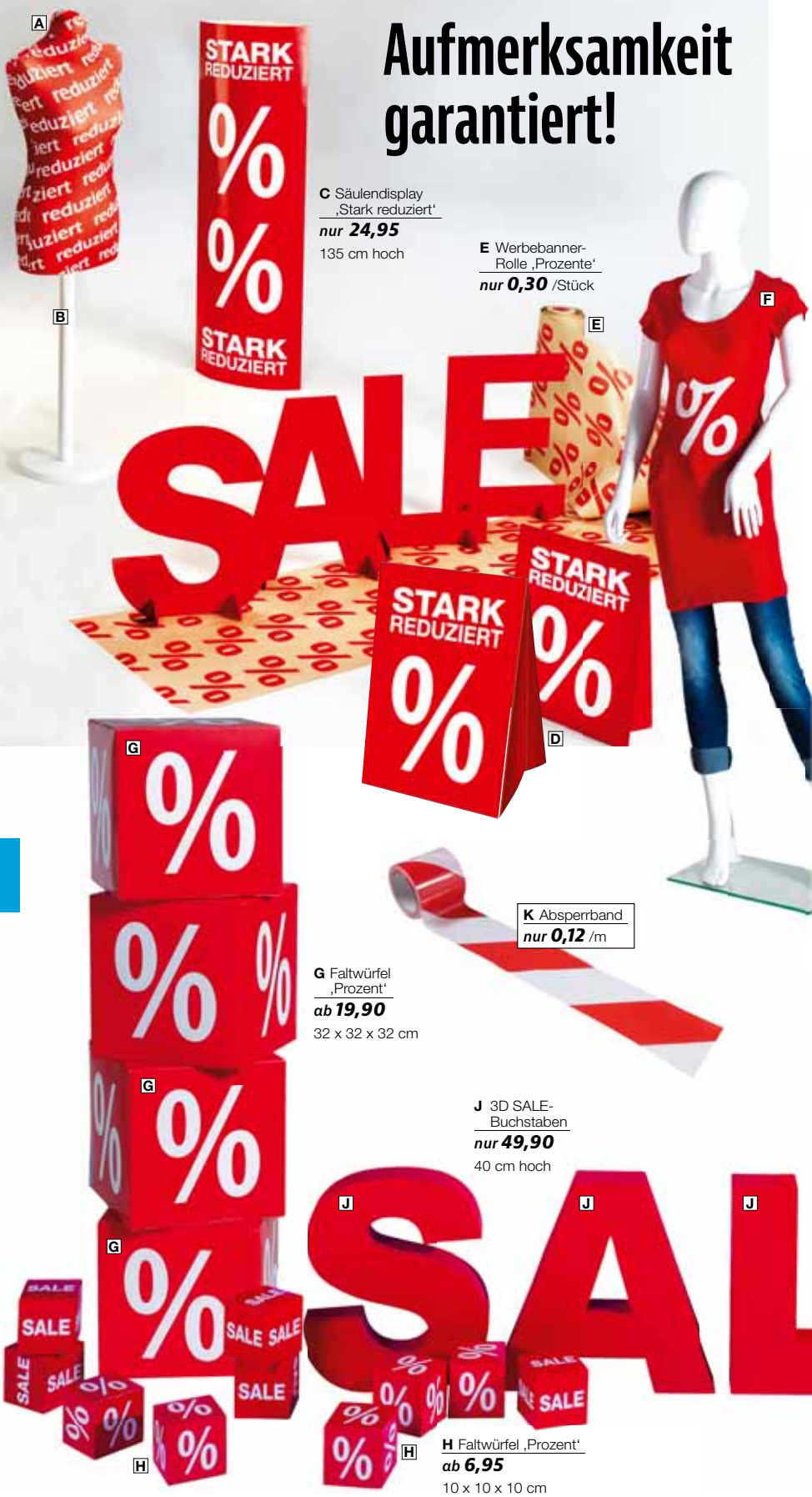
C Säulendisplay „Stark reduziert“ nur 24,95