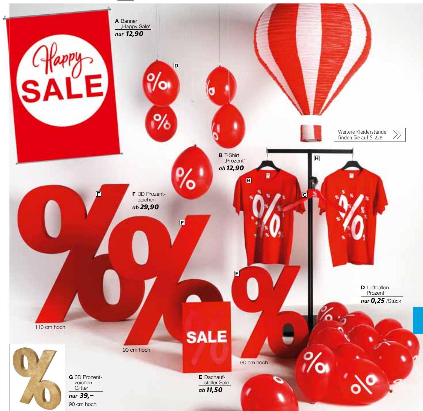
A Banner 'Happy Sale' nur 12,90