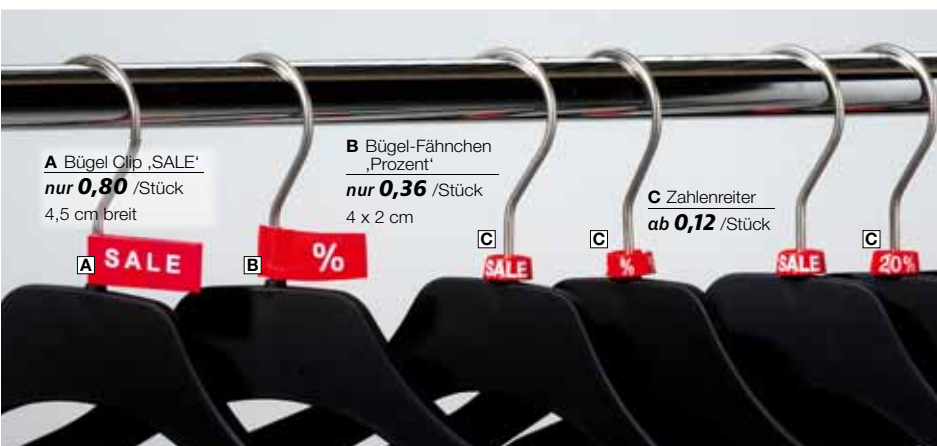
A Bügel Clip „SALE“ nur 0,80 /Stück 4,5 cm breit